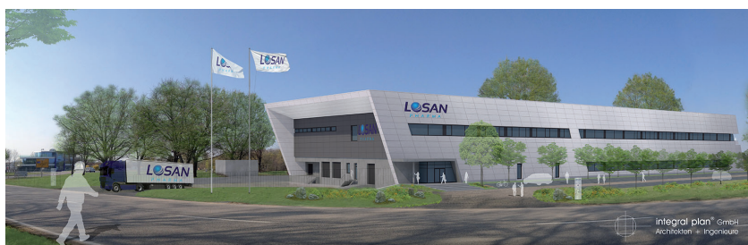
Geplanter neuer Produktionsstandort im Gewerbepark Breisgau.