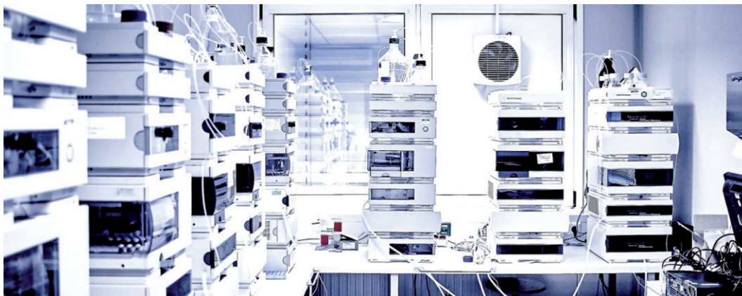
Analytik / Produktion Losan Pharma.

fischen internationalen Anforderungen. Neben den regelmäßig durchgeführten Inspektionen durch das zuständige Regierungspräsidium wird die Losan Pharma jährlich durch etwa 15 Kunden aus der ganzen Welt auditiert. In den letzten 12 Monaten wurden zudem das zweite Audit der US amerikanischen Gesundheitsbehörde FDA sowie auch das der brasilianischen Gesundheitsbehörde ANVISA nach Unternehmensangaben erfolgreich und ohne Beanstandungen bewältigt. Darüber hinaus werden zunehmend Inspektionen weiterer Behörden durchgeführt, u. a. aus afrikanischen und asiatischen Staaten. Die erfolgreichen Inspektionen von Kunden und Behörden bestätigen, dass die Losan Pharma heute über höchste Qualitätsstandards verfügt und im globalen Pharmamarkt sowohl die Kundenansprüche internationaler Pharma-Firmen als auch die der national agierenden Partner erfüllt.