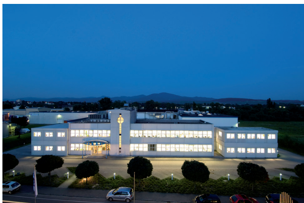
Der Standort Neuenburg der Losan Pharma GmbH (Quelle: alle Abbildungen Losan Pharma GmbH).